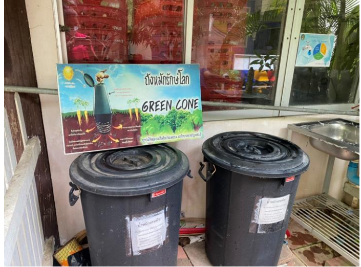
ภาชนะจากบรรจุภัณฑ์ก็แยกประเภททิ้งในขยะที่จัดเตรียมไว้