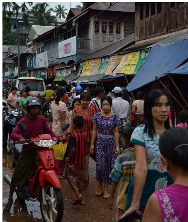
ตลาดตะนาวศรี