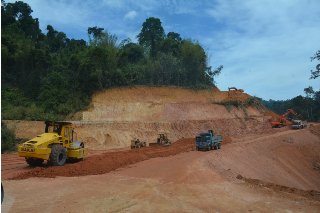
ภาพการทำถนนช่วงเขาแดนน้อย