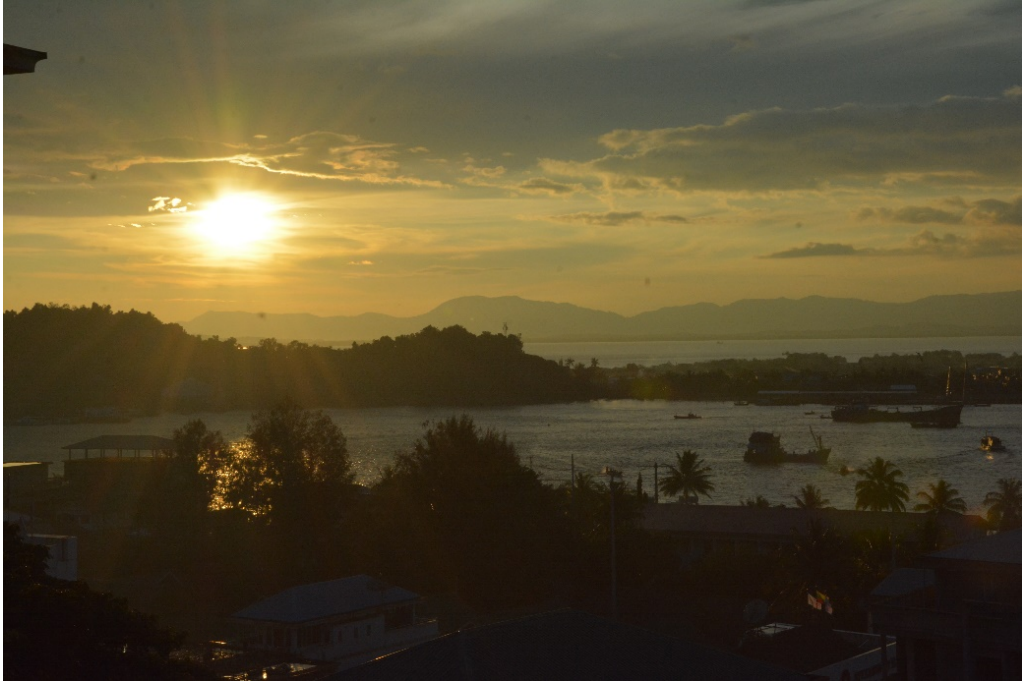
ทิวทัศน์เมืองมะริด