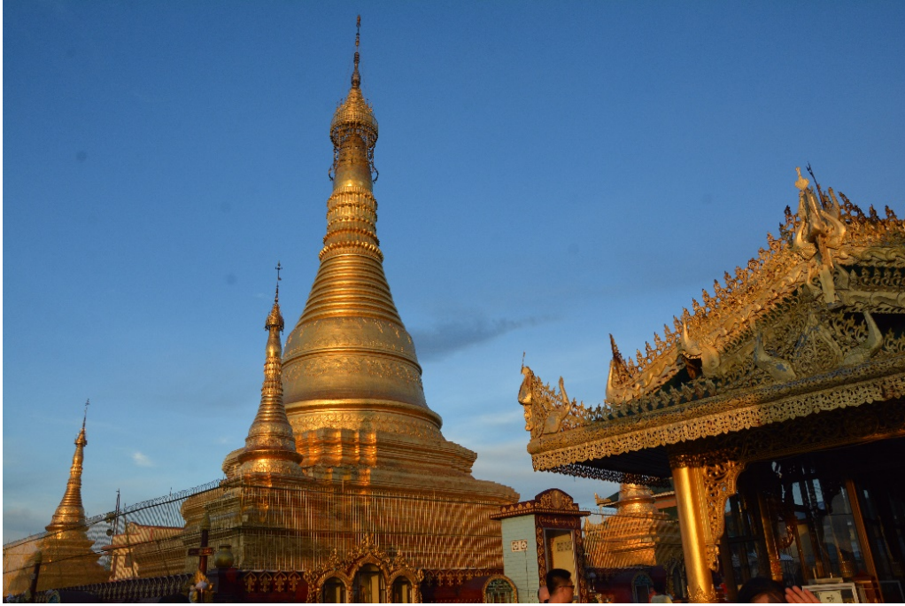
มหาเจดีย์วัดเตงดอจี