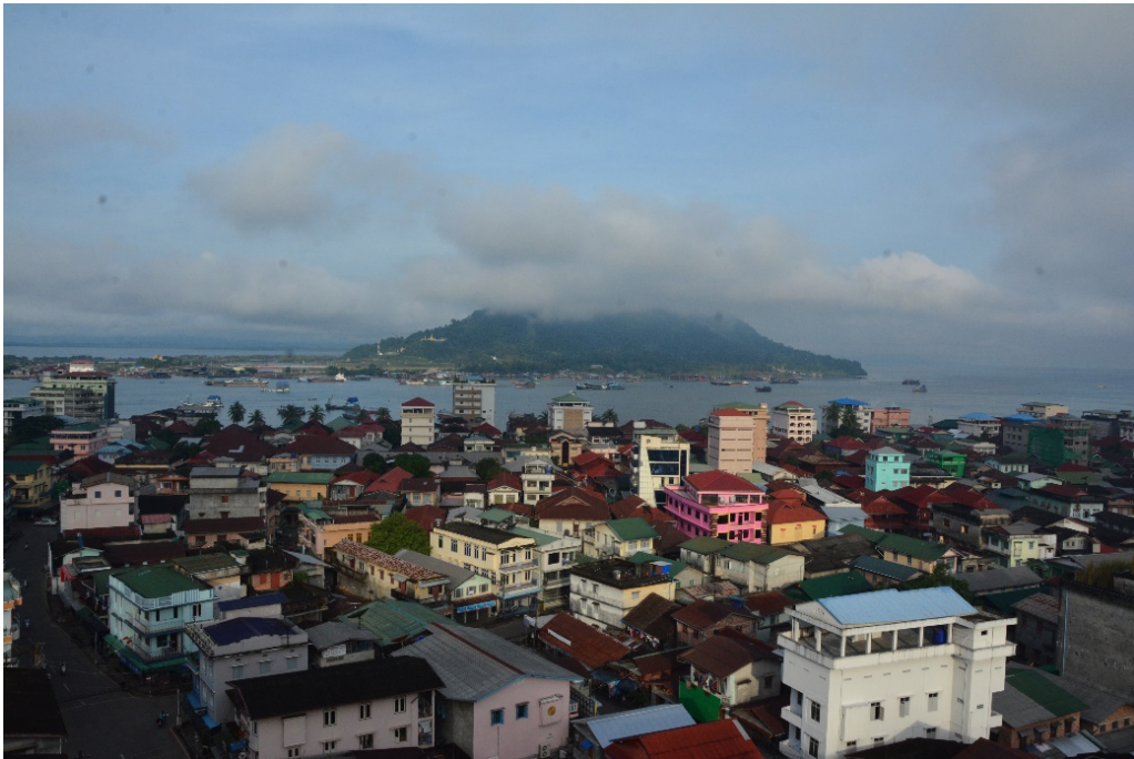
ทิวทัศน์เมืองมะริด