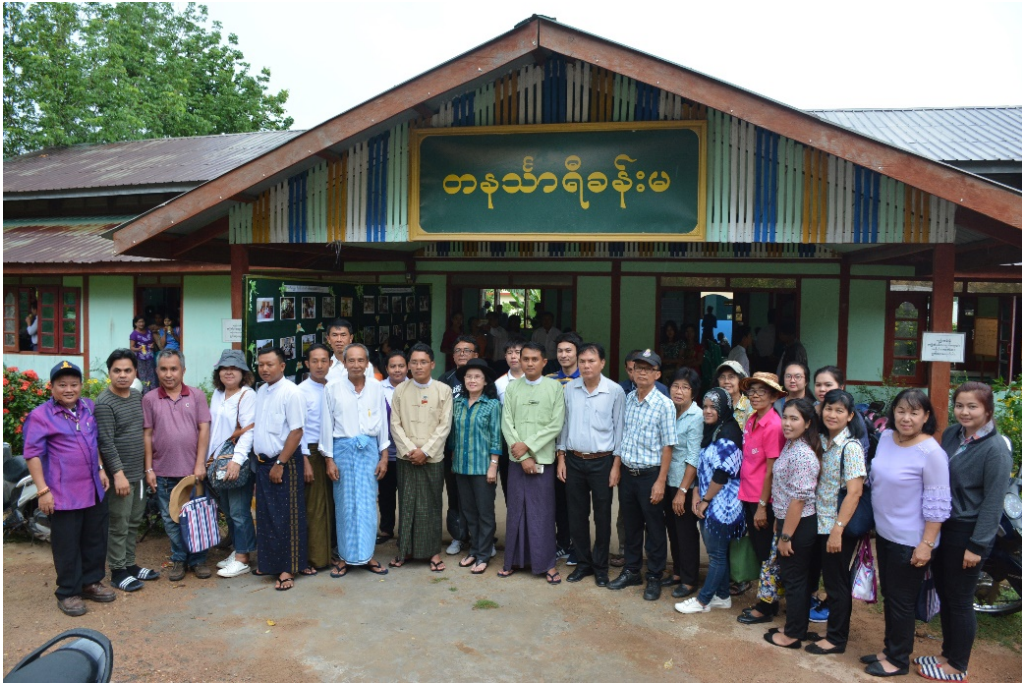
คณะนักวิจัยและศึกษาดูงาน