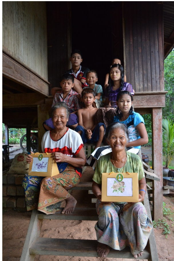
ครอบครัวชาวไทยสิงขร