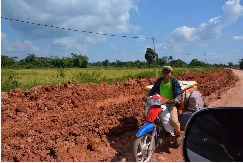
ภาพการทำถนนช่วงบ้านทุ่งข่า

ด้านการท่องเที่ยว มหาวิทยาลัยราชภัฏเพชรบุรีมีการศึกษาและดำเนินการเกี่ยวกับการจัดการการท่องเที่ยวในพื้นที่ดังกล่าวโดยเฉพาะประเด็นด้านการท่องเที่ยวเชิงวัฒนธรรมที่ดำเนินการมาอย่างต่อเนื่องและหลากหลาย โดยมุ่งเน้นการพัฒนาศักยภาพและการจัดการท่องเที่ยวในเขตพื้นที่ชายแดนไทย สิงขร มะริด และเส้นทางที่เชื่อมโยงพื้นที่ตั้งแต่ในประเทศไทยผ่านบ้านด่านสิงขร ตะนาวศรี ไปจนถึงเมืองมะริด สาธารณรัฐแห่งสหภาพเมียนมา มีผลงานศึกษาวิจัย บทความวิชาการ และองค์ความรู้หลายเรื่องในประเด็นนี้ ได้แก่ การศึกษาข้อมูลวิถีชีวิตคนไทยในชุมชนคนไทยพลัดถิ่นบ้านสิงขร การศึกษาแหล่งเรียนรู้ทางประวัติศาสตร์สมัยสงครามโลก ครั้งที่ 2 การศึกษาเส้นทางการค้าในสมัยอยุธยา เส้นทางการเดินทางในสมัยกรุงศรีอยุธยา - กรุงรัตนโกสินทร์ การศึกษาเส้นทางท่องเที่ยวเชิงวัฒนธรรมชุมชนหัวบ้าน ชุมชนหินเหล็กไฟ จังหวัดประจวบคีรีขันธ์ การศึกษาเส้นทางท่องเที่ยวเชิงนิเวศประวัติศาสตร์ทวารวดี - ทุ่งเศรษฐี และการศึกษาเส้นทางท่องเที่ยวเชิงประวัติศาสตร์มะริด - สิงขร ซึ่งเป็นเส้นทางท่องเที่ยวที่ได้รับความสนใจและการตอบรับจากนักท่องเที่ยวที่ร่วมพัฒนาเส้นทางกับมหาวิทยาลัยเป็นอย่างดี นอกจากนี้ ยังมีบทความวิชาการที่แสดงให้เห็นความเกี่ยวข้องของเชื่อมโยงของเส้นทางสิงขร มะริด กับประเทศไทยที่น่าสนใจ ได้แก่ บทความเรื่องพระเจ้าเลียบโลก ปราบยักษ์ นาคสร้างเมือง ตำนานท้องถิ่นเมืองตะนาวศรี บทความเรื่องบ้านบ่อเมืองสาครบุรี ชุมชนโบราณบนเส้นทางเชื่อมโยงหัวเมืองปากใต้ บทความเรื่องอยุธยาในเมืองประจวบฯ และบทความเรื่องศิลปกรรมอย่างสยามในเมืองมะริด และตะนาวศรี