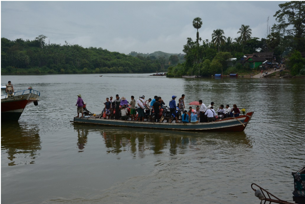
เรือข้ามฟากแม่น้ำตะนาวศรี