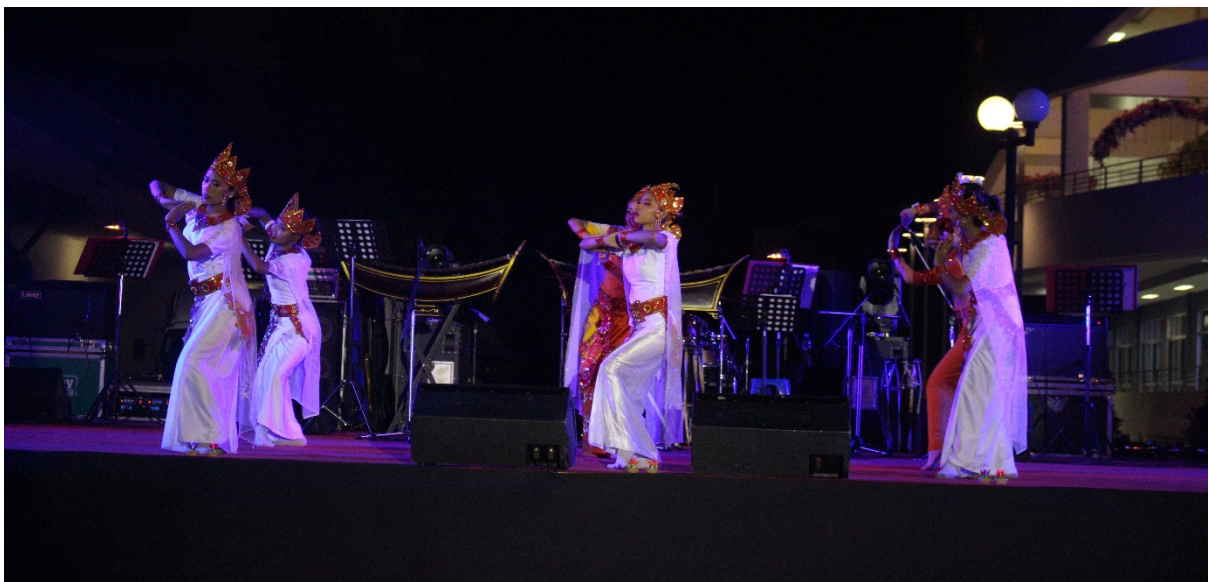
การแสดงจากมหาวิทยาลัยมะริด