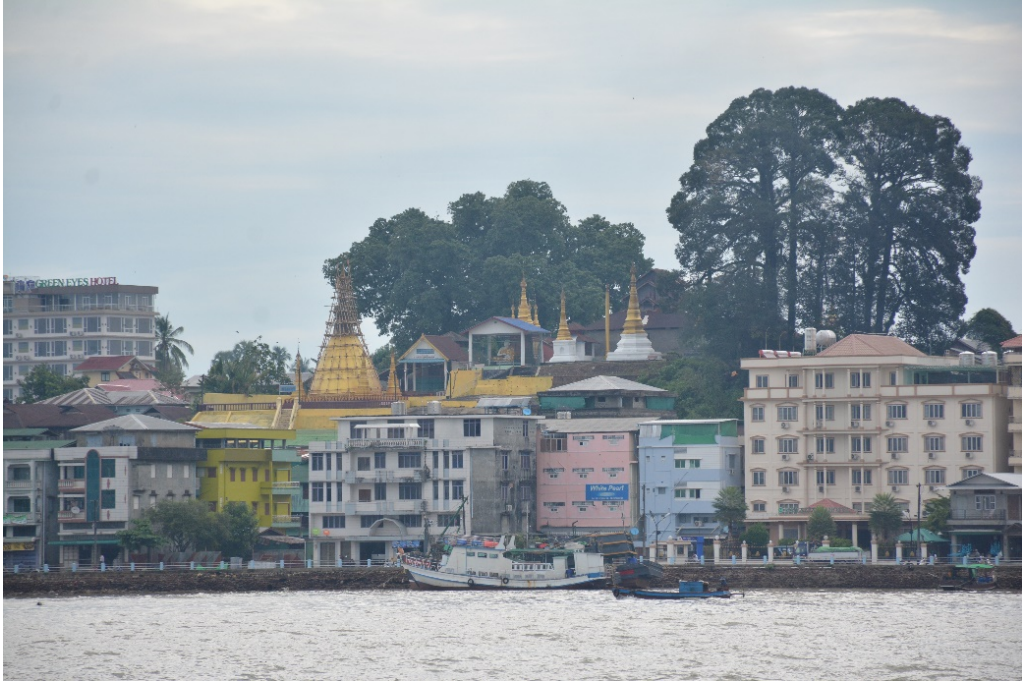
ทิวทัศน์เมืองมะริด