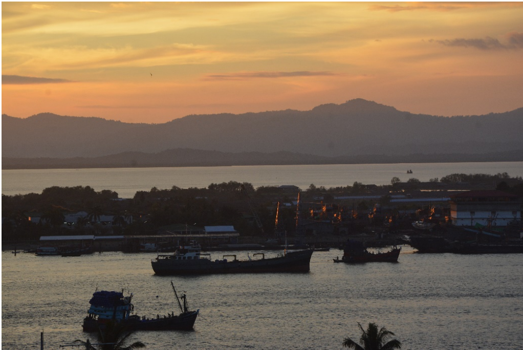
ทิวทัศน์เมืองมะริด