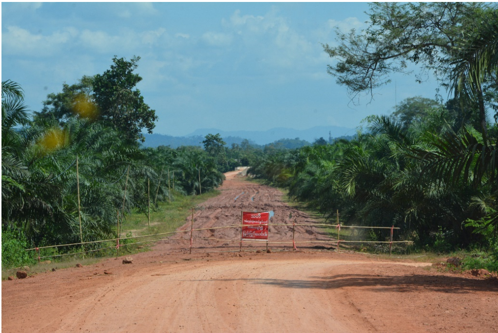
ภาพการทำถนนช่วงบ้านทุ่งข่า