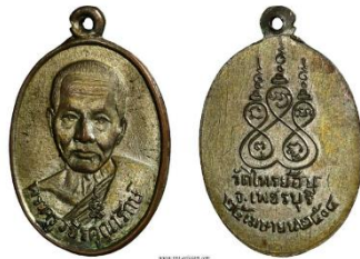
เหรียญหลวงพ่อบรรพชา วัดไทรน้อย เพชรบุรี รุ่นแรก ปี พ.ศ. ๒๕๐๔ เนื้อทองแดงกะไหล่เงิน

สร้างขึ้นในปี พ.ศ. ๒๕๐๔ เพื่อแจกเป็นที่ระลึกในคราวฉลองสมณศักดิ์ของหลวงพ่อบรรพชา ลักษณะเป็นเหรียญรูปไข่แบบมีหูในตัว มีการสร้างด้วยเนื้อทองแดงเพียงชนิดเดียวเท่านั้น จำนวนการสร้างไม่ได้มีการจดบันทึกไว้ แต่คาดว่าไม่น่าเกิน ๒,๐๐๐ เหรียญ