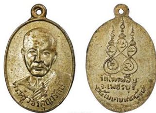
เหรียญหลวงพ่อบรรพชา วัดไทรน้อย เพชรบุรี รุ่นแรก ปี พ.ศ. ๒๕๐๔ เนื้อทองแดงกะไหล่เงิน

ด้านหน้า จำลองเป็นรูปหลวงพ่อบรรพชาครั้งองค์ห่มจีวรลดไหล่พาดผ้าสังฆาฏิ ที่ริ้วจีวรมีอักขระยันต์ตัว "เตาหะ" ได้รูปหลวงพ่อบรรพชาอักขระภาษาไทยเขียนว่า "พระครูวิชิตคุณารักษ์"