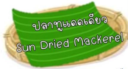
ปลาแดดเดียว Sun Dried Mackerel